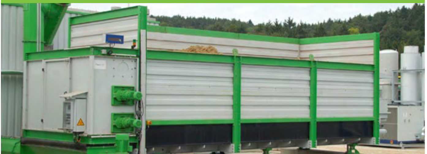
Abbildung: Schmack Biogas Komponenten GmbH