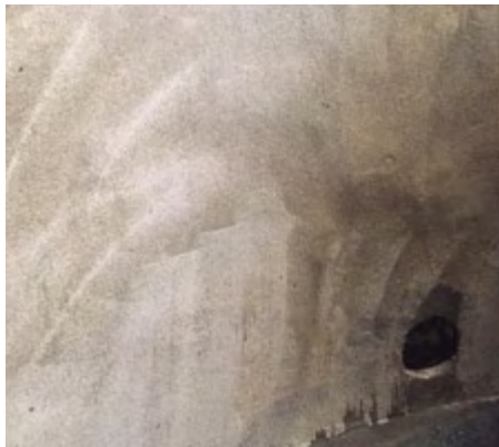
Grundierte Wandfläche, mit Quarzsand abgestreut