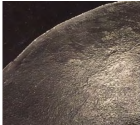
Übergang Wand- und Bodenfläche, beschichtet