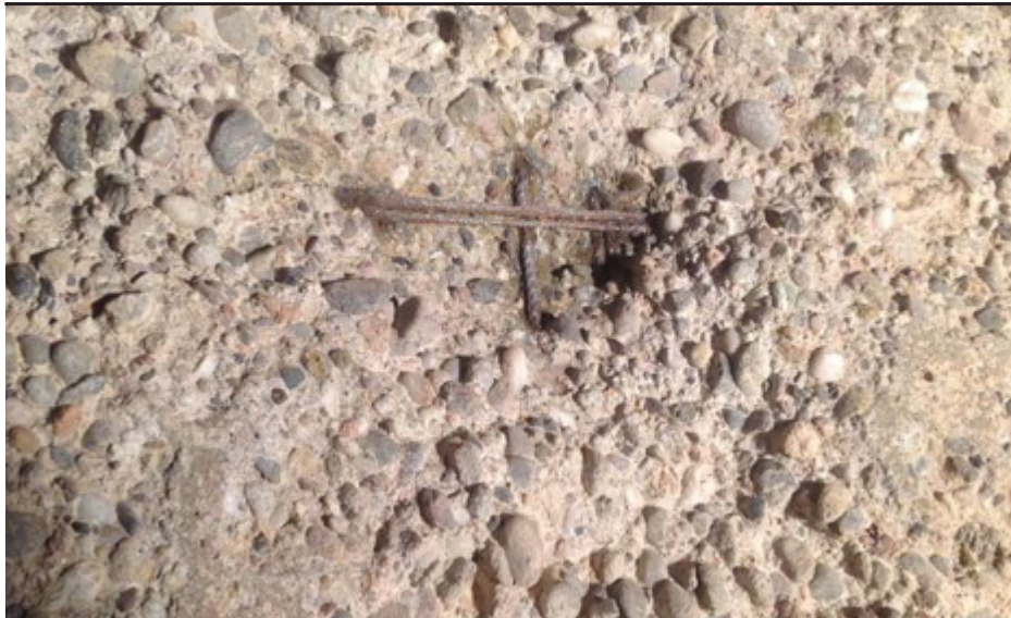
„Washbeton-Effekt“ - hervorgerufen durch aggressive Säuren im Gärfutter