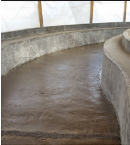
Grundierung des Betonkanals mit CP-SYNTOFLOOR 8010