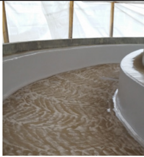
Nach der Grundierung wurde Fläche angeschliffen und das Beschichtungsprodukt PROGUARD CN 200 aufgetragen