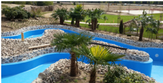
Vollendetes Projekt mit unserem effektiven 3-Schicht-Konzept

„Tropical Islands“ ist Europas größte tropische Urlaubswelt mit einzigartigen Wasserparks, Attraktionen und auch Übernachtungsmöglichkeiten. Vor Kurzem wurde im Außenbereich AMAZONIA Deutschlands längster Strömungskanal „Wild-Water-River“ eröffnet. Zum Schutz vor UV-Strahlung, Verwitterung und Abrieb wurde der 250 m lange Betonkanal mit unseren Beschichtungssystemen versehen.