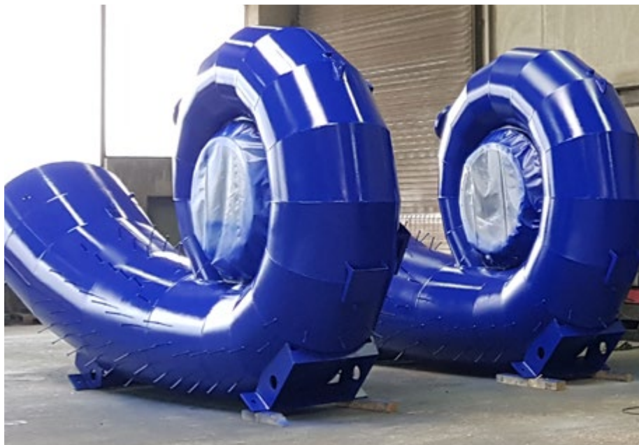
Die Spiralzuläufe weisen einen Durchmesser von 3,60 Metern auf.